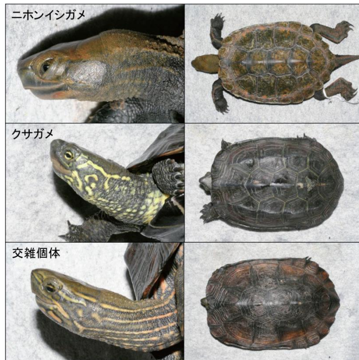
図1. ニホンイシガメ, クサガメ, 交雑個体の写真. Suzuki et al. (2014)より一部改変.